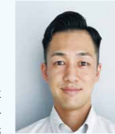
小林立 義太夫 株式会社