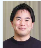
パナソニックコネク 株式会社