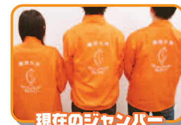
現在のジャンパー