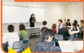
アサーショントレーニング講座

詳しく知りたい方は凜風館1階ボランティアセンターまで走れ!もしくは関西大学ボランティアセンターHPをクリック!!