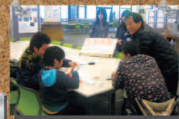
▲ 学園祭、「福祉フェスティバル」 点字体験コーナー