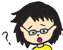
悩める関大生 ほらせん はじめ 菩薩仙 一くん

さあ、新学期！この春はボランティア活動してみたい！でも、一体何から始めればいいのか…？