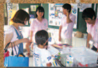
▲ エコキャップキャンペーン

私たちは、「関大生にボランティアを広めること」を目標に、職員さんと一緒に活動しています。様々なボランティア活動やキャンペーンの企画・運営が主な活動で、そのための定例会議も行います。他大学の学生スタッフや地域の方々と関わる機会も多いので、学ぶこともたくさんあります★